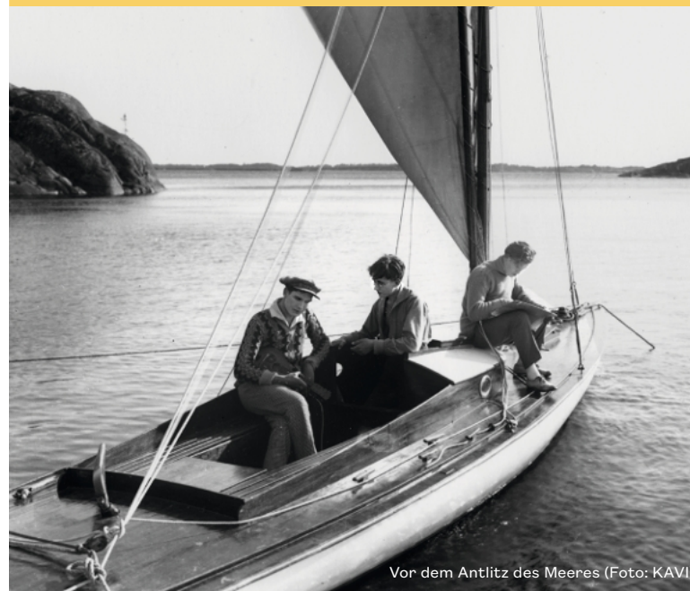
Vor dem Antlitz des Meeres

Frankreich & Italien 2021 / Regie: Céline Gaillieur & Olivier Bohler / 94' / DCP / englische Originalversion Eintritt: €9 / €7 (ermäßigt)